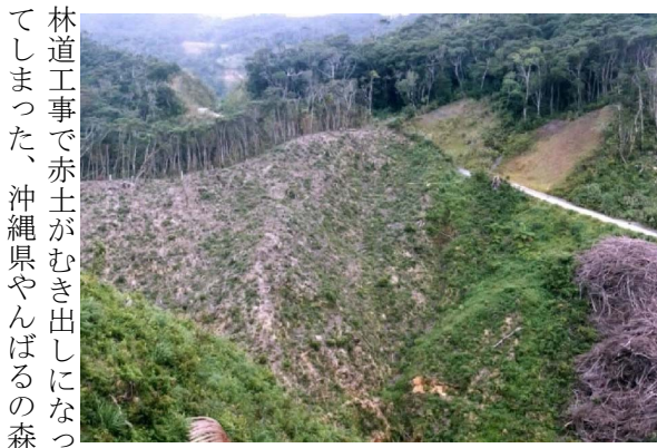
林道工事で赤土がむき出しになっ てしまった、沖縄県やんばるの森

http://homepage3.nifty.com/sizennokenri/