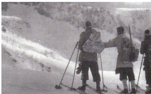
白山甚ノ助避難小屋より南竜ヶ馬場方面をのぞむ