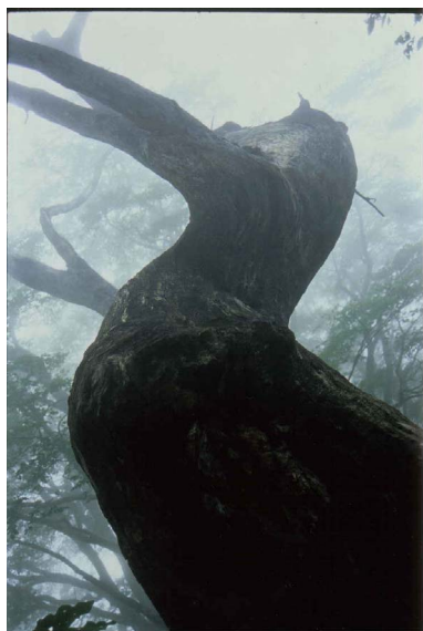
霧のチブリ尾根で見かけた朽ちたブナの木

口までの区間も作業範囲に入ります。この部分は、登山道の部分よりもアプローチが容易ですので、体力的に不安のある方でも参加出来るようです。この区間ではブナ林があるわけではありませんが、そんな中でも思いがけない森との出会いがきっとあるはずです。以前にアイドル歌手の新田恵利が「若草の招待状」なんて曲を歌っていましたが、これまで参加を躊躇していた方々も、チブリの森から招待状をもらったつもりで気軽に参加してみてはいかがでしょうか。