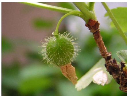
夜叉柄杓の未熟果実