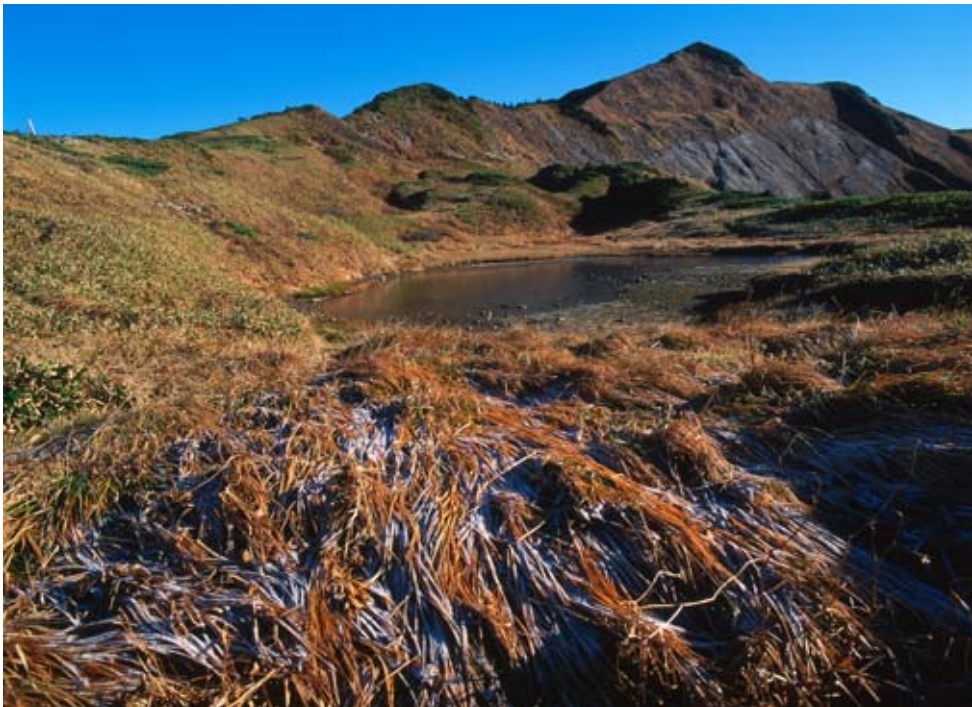
秋の別山 木村芳文